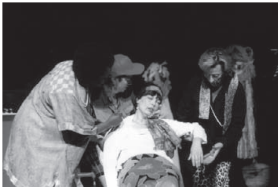
Scène du spectacle "Chloé".

A la suite de la première de "Femme-sandwich", une Aragne de longue date témoigne: « Quel bonheur de passer son message : la femme, éternelle, forte, qui se cherche, qui trouve en elle un "volcan de richesses inconnues" et qui donne. Quand on fait du théâtre, c'est justement cela qui est important : DONNER, se donner en fin de compte ».