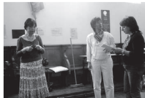
Des comédiennes de Femme-Sandwich en répétition à Assesse.

Le lieu des rencontres et des répétitions est décidé d'après les villages d'origine des femmes, même si les kilomètres ne leur font pas peur. Certaines n'hésitent pas à faire près d'une heure de trajet pour participer à l'atelier. «C'est une autre habitude qu'en ville. Ici, il faut