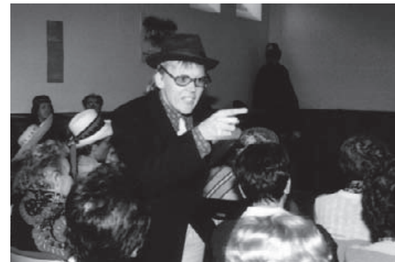
Dans "L'effet boomerang" une Aragne interpelle le public.

Pour les Aragnes, même si « c'est effrayant de porter sa parole vers un public car ce n'est pas un texte d'auteur », il y a une véritable envie de faire passer un message. « On joue. On espère faire réagir les autres et les provoquer. »