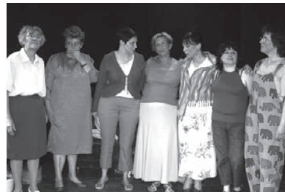
Le groupe des comédiennes de "Femme-sandwich" en juin 2006.

La participation à l'atelier des Aragnes est un projet en soi. Si les représentations sont bien entendues importantes, c'est tout le processus de construction du groupe et sa dynamique qui semble fondamentale. «Sortir de son trou» , «faire partie d'un groupe» , «se frotter l'une à l'autre» , «réfléchir avec les autres» sont des aspects incontournables des Aragnes. «Il faut du temps pour se sentir Aragne» car l'évolution du groupe, les départs et les changements ne sont pas toujours vécus facilement.